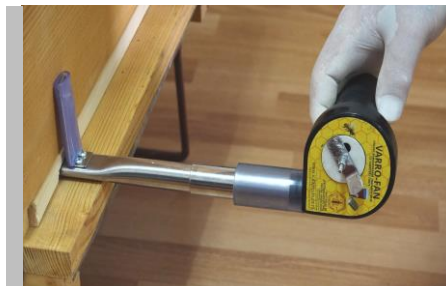
Fig.8. Poziționarea ventilatorului asigură efectuarea tratamentului indiferent de garda la sol a stupului.