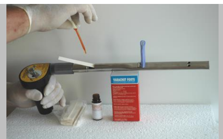
Fig.1. Introducerea parțială a benzii și aplicarea picăturilor conform prospectului.