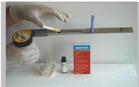
Fig.2. Împingerea benzii în camera de ardere.