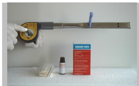
Fig.7. Reglajul debitului de aer și implicit a vitezei de ardere a benzii.