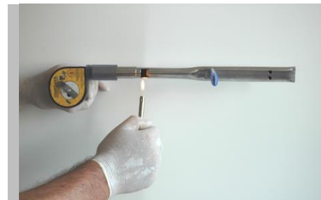
Fig.3. Aprinderea benzii.