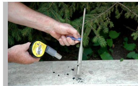
Fig.6. Eliminarea cenușii rezultate din arderea benzii.