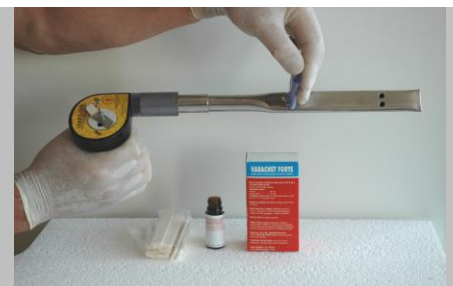
Fig.4. Închiderea orificiului prin împingerea tubului spre ventilator.